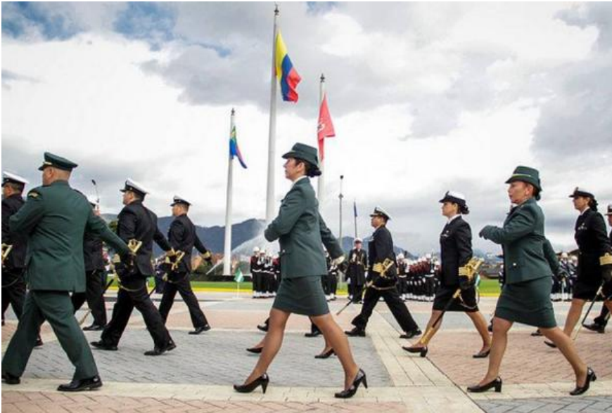
Acore apoya Justicia Transicional para militares

Tweet 4 | +1 0 | Blogger | Me gusta | Compartir 14 | ShareThis